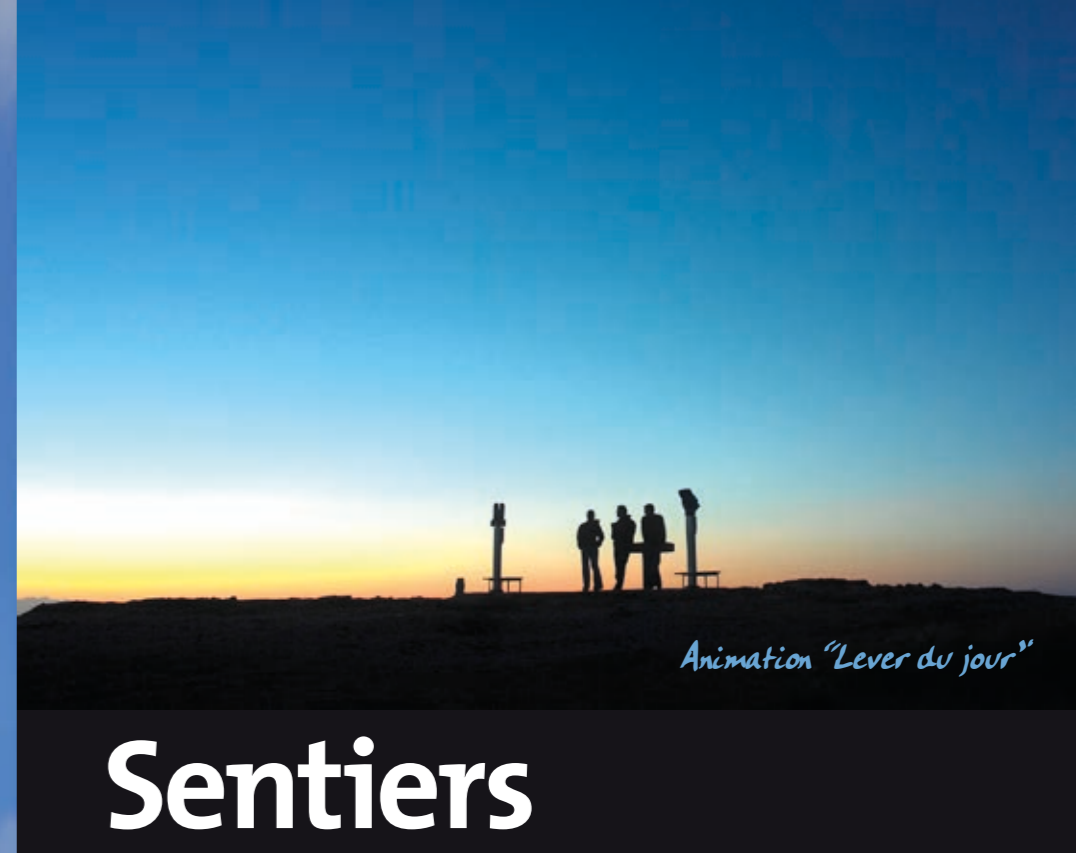
Animation "Lever du jour"