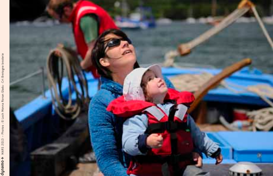
djynamo + MATIS 2013